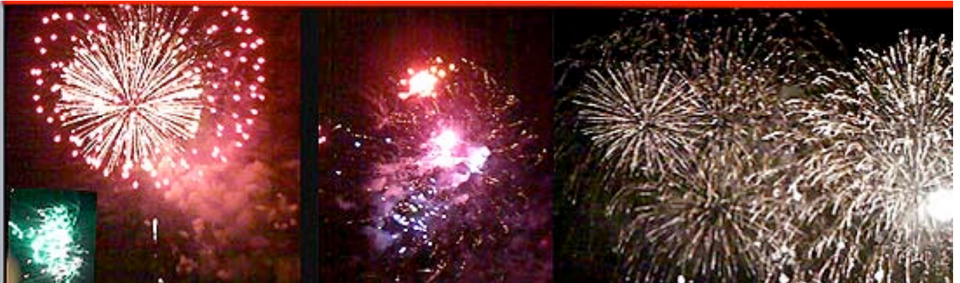
Families regular meeting of enjoying the cool breeze at Sasebo US base. 1. Aug. 2009.

セントラルホテル佐世保 佐世保市上京町3-2 TEL.0956-25-5595, FAX. 0956-25-3445 E-mail: chuo.cc@theia.ocn.ne.jp