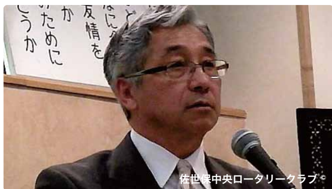
佐世保中央ロータリークラブ