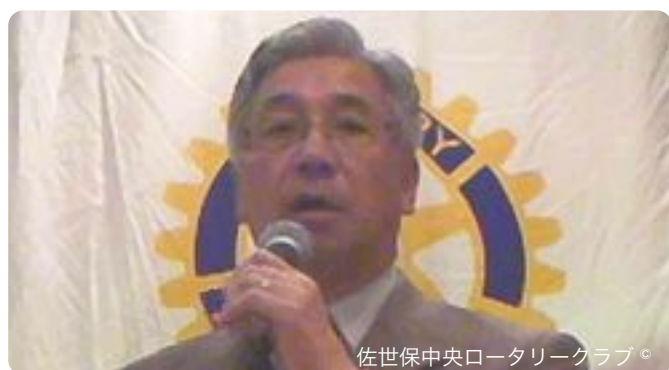
佐世保中央ロータリークラブ。

最近カレンダーを眺めるのが大変楽しみになってきました。今日で5月最後の例会です。残り1ヶ月4回の例会を残すだけです。