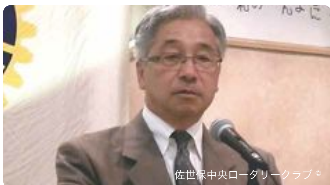
佐世保中央ロータリークラブ。