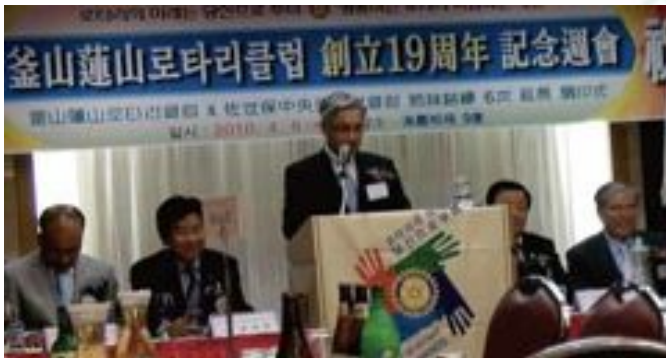
2010年4月8日 釜山蓮山ロータリークラブ公式訪問