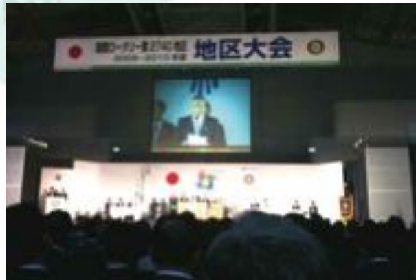
2009年11月7日 島原地区大会