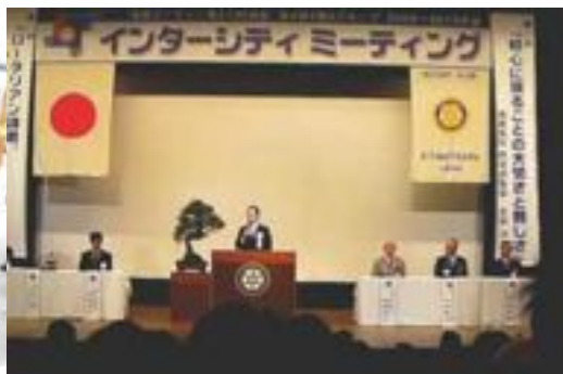
2010年2月7日 IM(インターシティ・ミーティング)