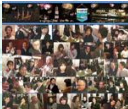
2009年12月12日 忘年家族例会