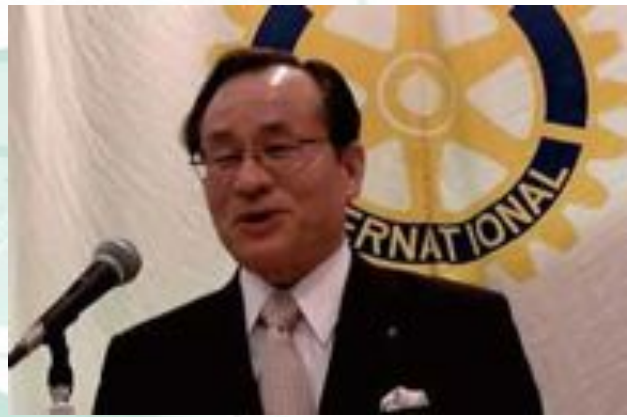
市長卓話・2009年8月6日と2010年4月22日