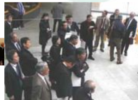
2010年1月28日 職場訪問例会(海きらら)