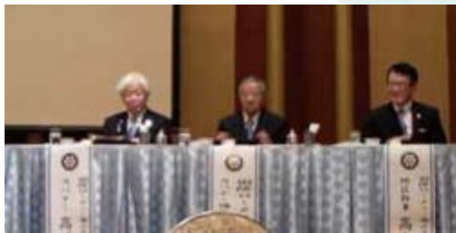
2009年9月7日 ガバナー公式訪問 佐世保東ロータリークラブとの 合同例会