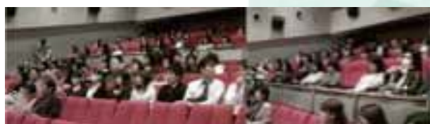
2009年11月12日 社員招待例会(映画例会)