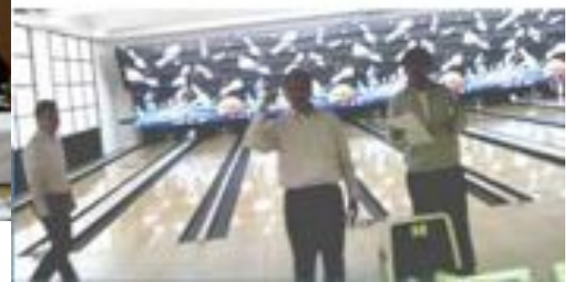
2010年3月11日 スポーツ例会(ボウリング)