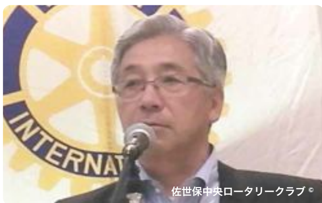
佐世保中央ロータリークラブ