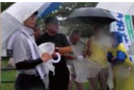
2009年7月20日 海の日に因んで ビーチクリーンアップ