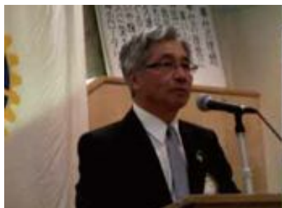
2009年7月2日 会長運営方針発表