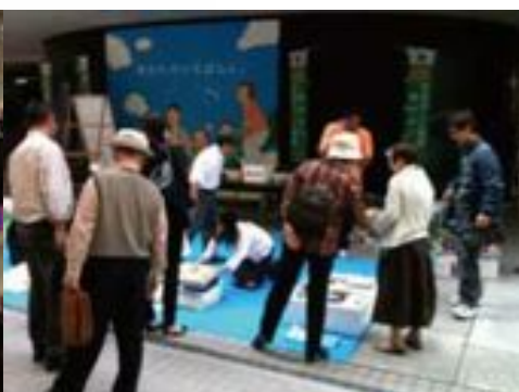
2009年11月11日 バザーの様 職業奉仕委員会