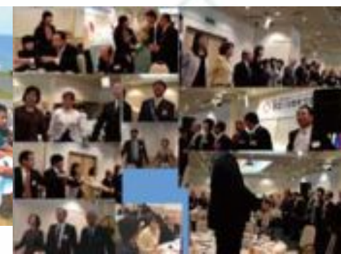
2009年10月8日 創立19周年記念例会