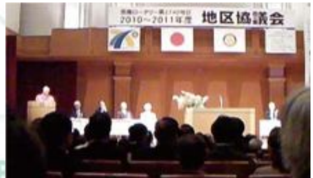
2010年5月14日 地区協議会