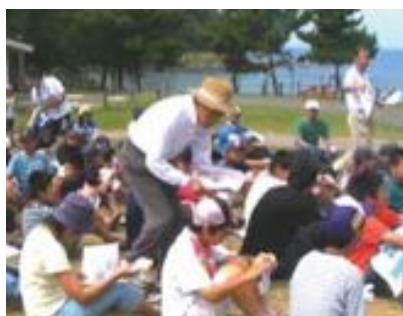
2009年9月5日 白浜クリーンアップ事業