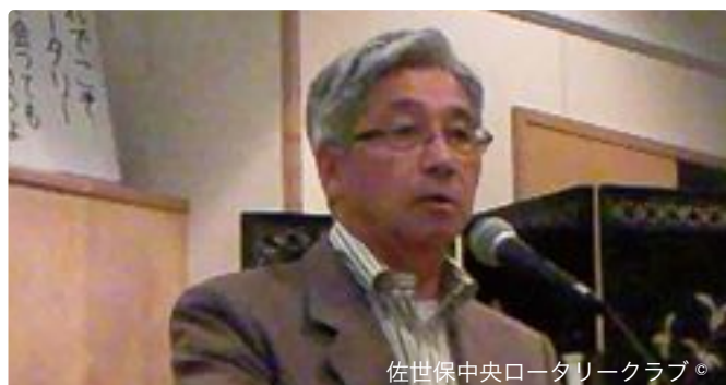
佐世保中央ロータリークラブ。

通常例会としては今日が最後の会長挨拶となります。14日のサッカーWカップ日本の勝利お見事でした。劣勢をはねのけての勝利に日本中大変な盛り上がりでした。こんなにサッカーファンがいたのかな?と思うぐらいの熱狂ぶりでした。皆さんも、しばらくは寝不足気味になりそうですが、仕事に影響ない程度に応援して下さい。19日のオランダ戦の試合も期待に応えられる良い試合を見せてほしいものです。